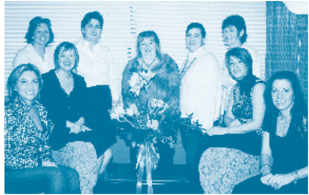
Personnel du siège social