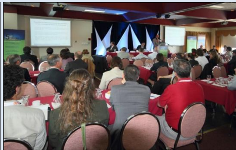
Salle de Bal