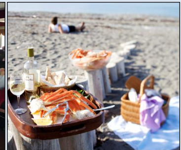
Festin de crabe en bord de mer