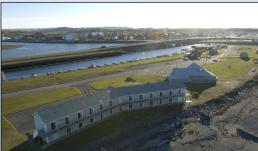
Pavillon sur mer

Tarif à la semaine disponible au pavillon sur mer pour vos travailleurs.